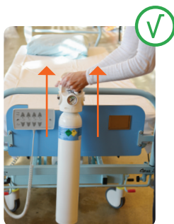
1) Løft op