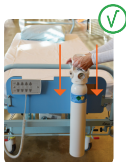
3) Sæt den fast på sengen igen