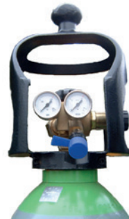
KVIK TOP® FLASKE

Strandmøllen tilbyder et stort udvalg af udstyr. Ring til Strandmøllen og hør mere om vore regulatorer, svejse- og skæreudstyr, flaskevogne m.m.